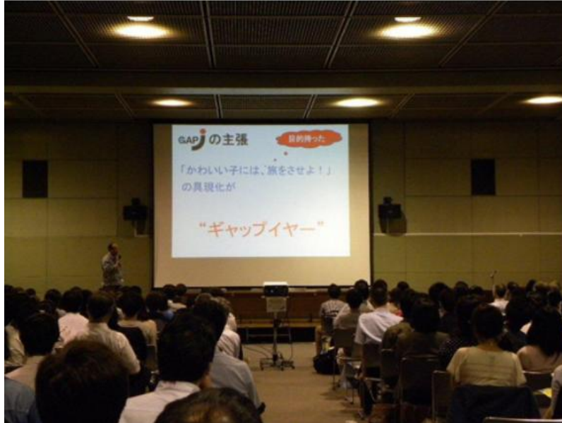
(2011年6月ギャップイヤー啓発イベント)

国内外の活動ブランド： 「ギャップイヤー・ジャパン GAPYEAR JAPAN」 (商標登録出願中) http://japangap.jp/